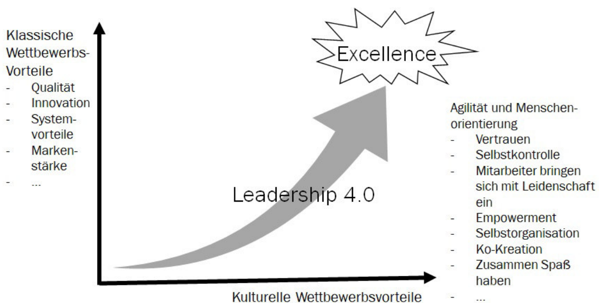
Abb. 1: Mit Leadership 4.0 zu Wettbewerbsvorteilen (eigene Abbildung)

Damit schafft Leadership 4.0 nachhaltigen Erfolg und mit der Betonung auf Kultur einen klaren zusätzlichen Wettbewerbsvorteil (neben den klassischen Wettbewerbsvorteilen wie Qualität, Innovation oder Markenstärke). In Anlehnung an musterbrecher® (Hans Wüthrich et al.) ergibt sich daraus ein anschauliches Modell: